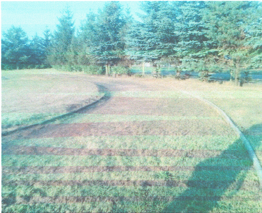
Rys. 3 Aktualny stan nawierzchni bieżni