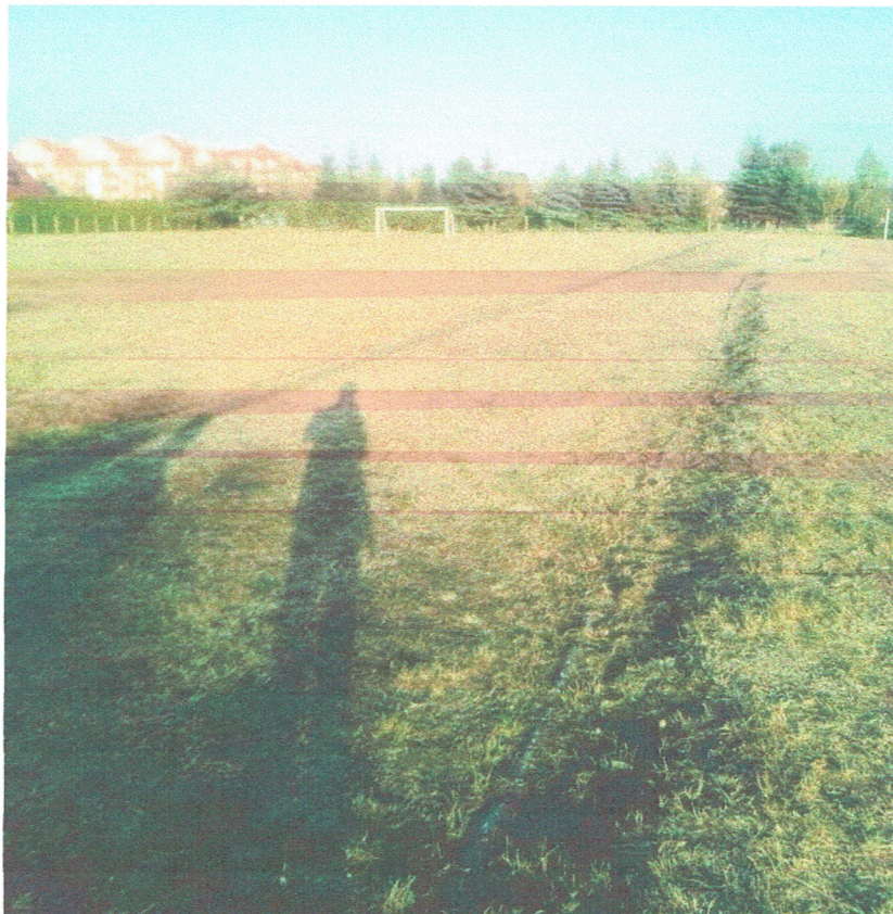
Rys. 4 Aktualny stan nawierzchni bieżni