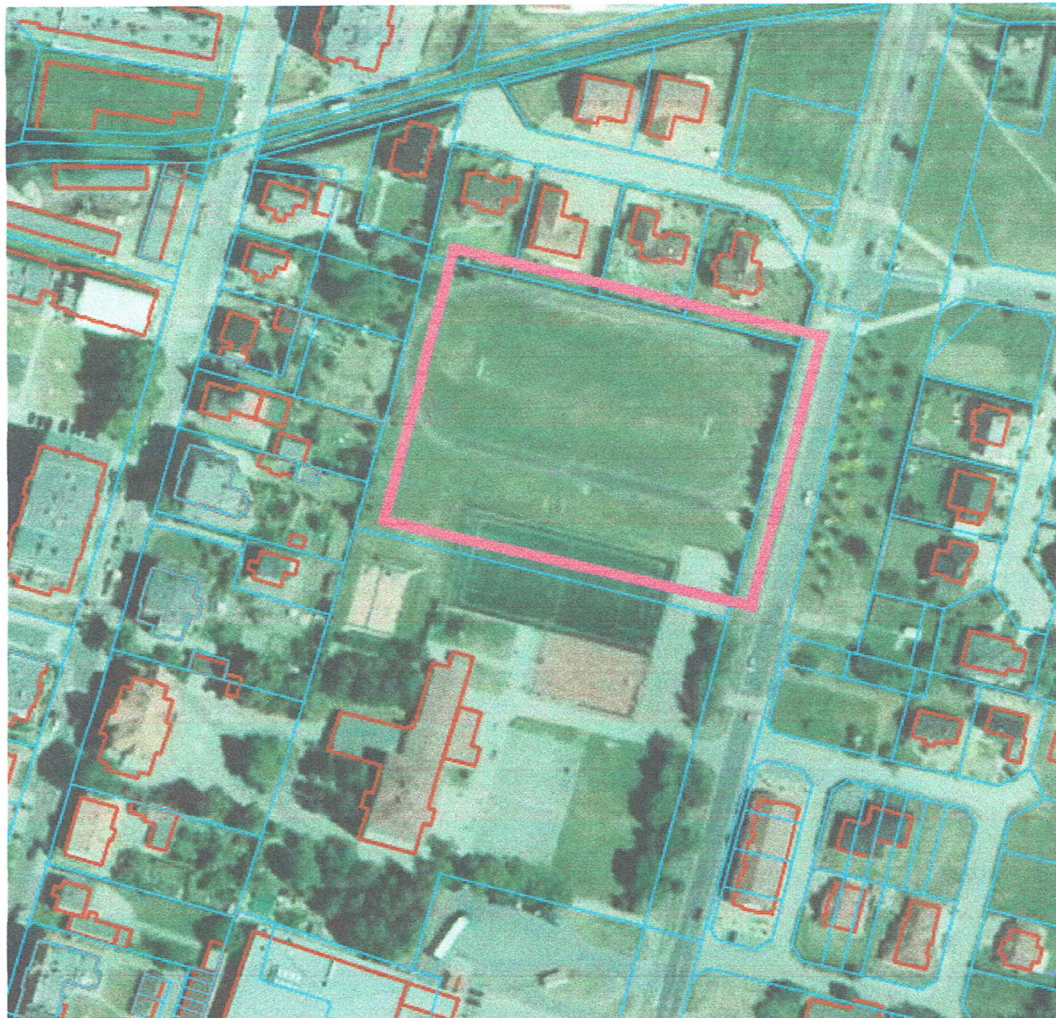
Rys. 1 Mapa z zaznaczoną lokalizacją terenu inwestycji