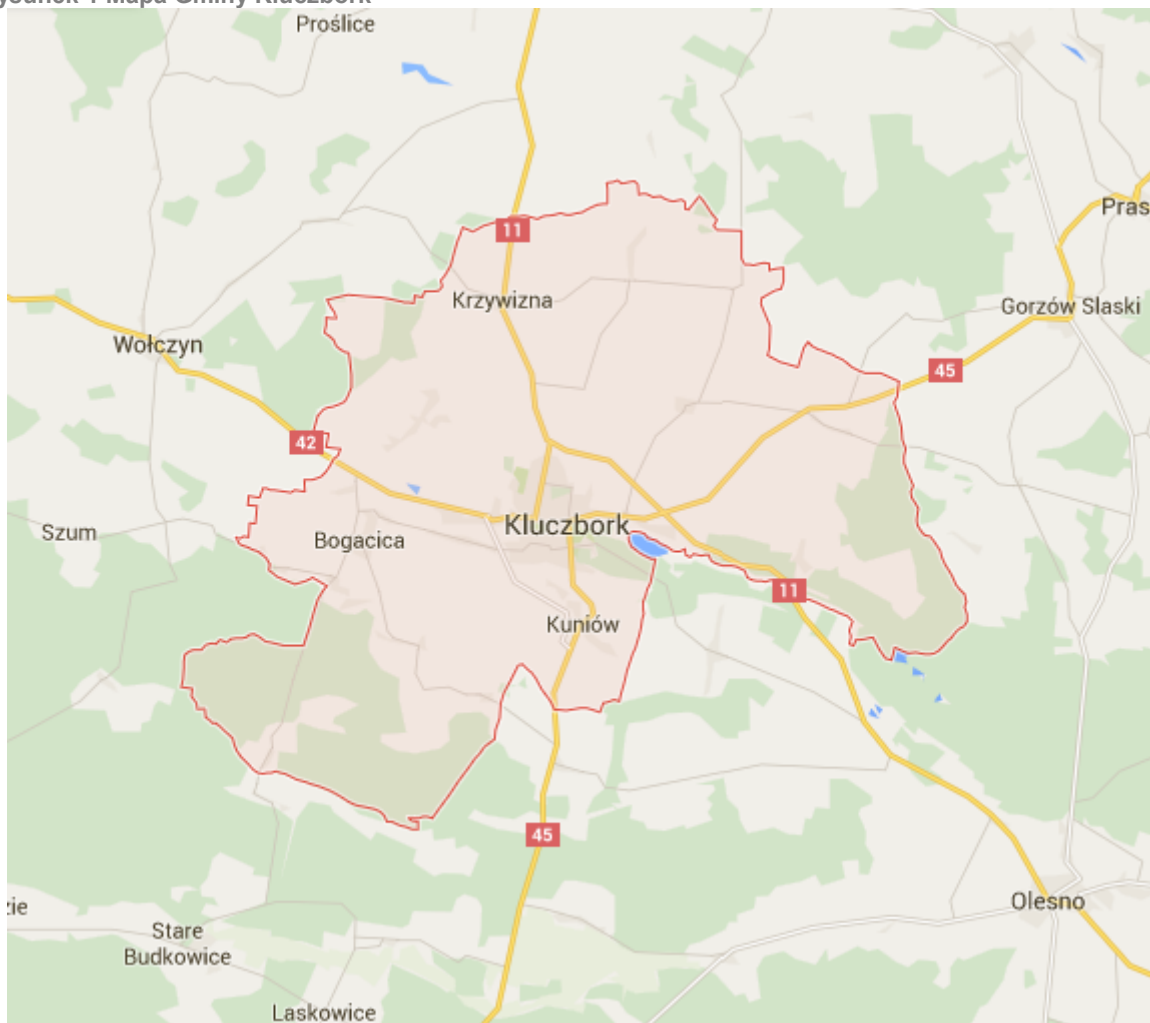
Rysunek 1 Mapa Gminy Kluczbork