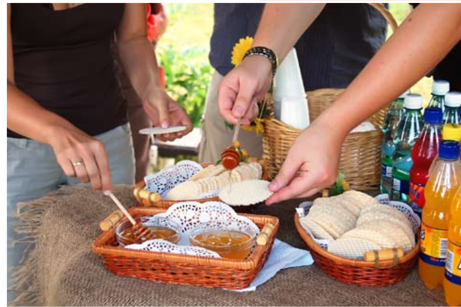
Maciejowskie Miodu Smakowanie – degustacja miodu

– zajęcia edukacyjne (doświadczenia) w świetlicy – poznanie etapów życia pszczoł, specyfiki komórek pszczelich, właściwości miodu, własnoręczny wyrób świec z cudownie pachnącej węzy pszczelej, które można zabrać ze sobą do domu. – zwiedzanie drewnianego kościoła (z XV w.) – zwiedzanie pałacu w Maciejowie – gry i zabawy terenowe, ognisko – pokaz szermierki z użyciem bezpiecznej broni (Go-Now). W Maciejowie została utworzona sekcja sportowa szermierki Go-Now. Jest to