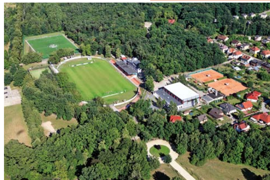
Wojewódzki Kampus Sportowo-Rekreacyjny STOBRAWA

Dalej szlak wiedzie przez park. Po przekroczeniu mostku na Stobrawie jesteśmy na obszarze Wojewódzkiego Kampusu Sportowo-Rekreacyjnego „STOBRAWA” , który jest położony w malowniczej scenerii zabytkowego Parku Miejskiego oraz w bezpośrednim sąsiedztwie lasów. Kompleks stanowi nowoczesną, interdyscyplinarną bazę sportowo-rekreacyjną stwarzającą idealne możliwości do organizacji obozów i zgrupowań sportowych dla zawodników oraz drużyn różnych dyscyplin sportowych zarówno z regionu województwa opolskiego, jak i całego kraju. Nowoczesna infrastruktura kampusu stwarza również możliwość organizacji konferencji, szkoleń oraz szeregu innych przedsięwzięć o charakterze rekreacyjno-sportowym. Baza ta spełnia wymogi sportu wyczynowego i charakteryzuje się wysokim standardem. Historia kampusu sięga początku XX wieku, gdyż to właśnie tutaj sportowcy różnych dyscyplin przygotowywali się do najważniejszych imprez sportowych. Obecnie Gmina Kluczbork wraca do chlubnych sportowych tradycji tego miejsca. Powierzchnia Kampusu wynosi 12 ha, jego właścicielem jest Gmina Kluczbork, która zarządza obiektami poprzez Ośrodek Sportu i Rekreacji.