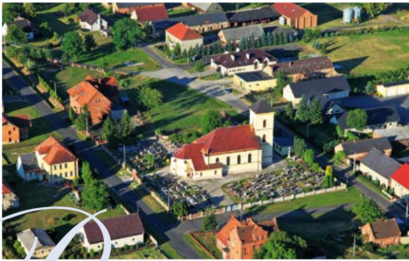
Kościół pw. Nawiedzenia Matki Boskiej w Łowkowicach