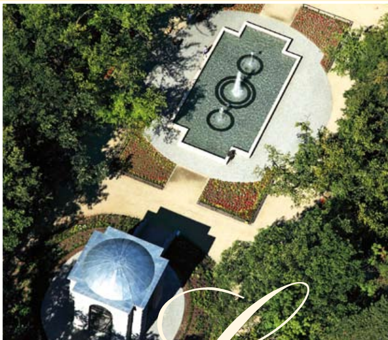
Park miejski w Kluczborku