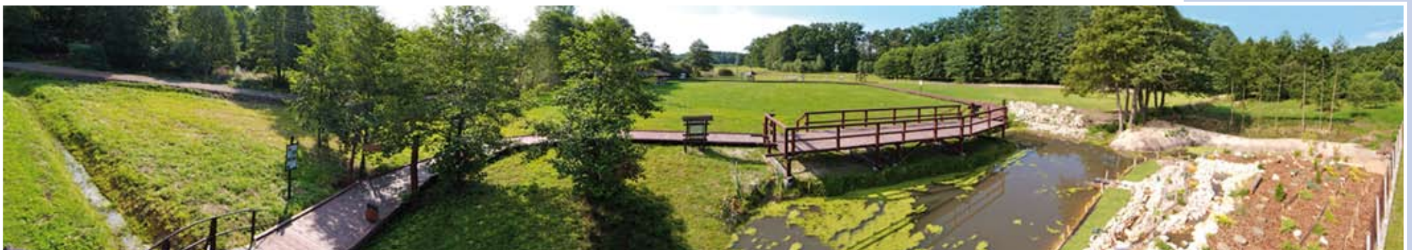
Leśna ścieżka edukacyjna w Lasowicach Małych

Trasa ścieżki edukacyjnej rozpoczyna się od zwiedzania Wyłuszcarni Nasion. Następnie ścieżka prowadzi przez drewnianą bramę i mostek na niewielką łąkę, gdzie rozmieszczone są stanowiska z tablicami na całej długości trasy liczącej ok. 1 km, które obrazują całokształt zagadnień związanych z życiem lasu w ścisłym powiązaniu z działalnością człowieka. Jednym z przystanków jest również potężny dąb szypułkowy liczący 220 lat, przy którym pokazano na tablicy ważniejsze wydarzenia z naszej historii. Ścieżkę edukacyjną zamyka rzeka Bogacica, która jest ciekawym ekosystemem słodkowodnym.