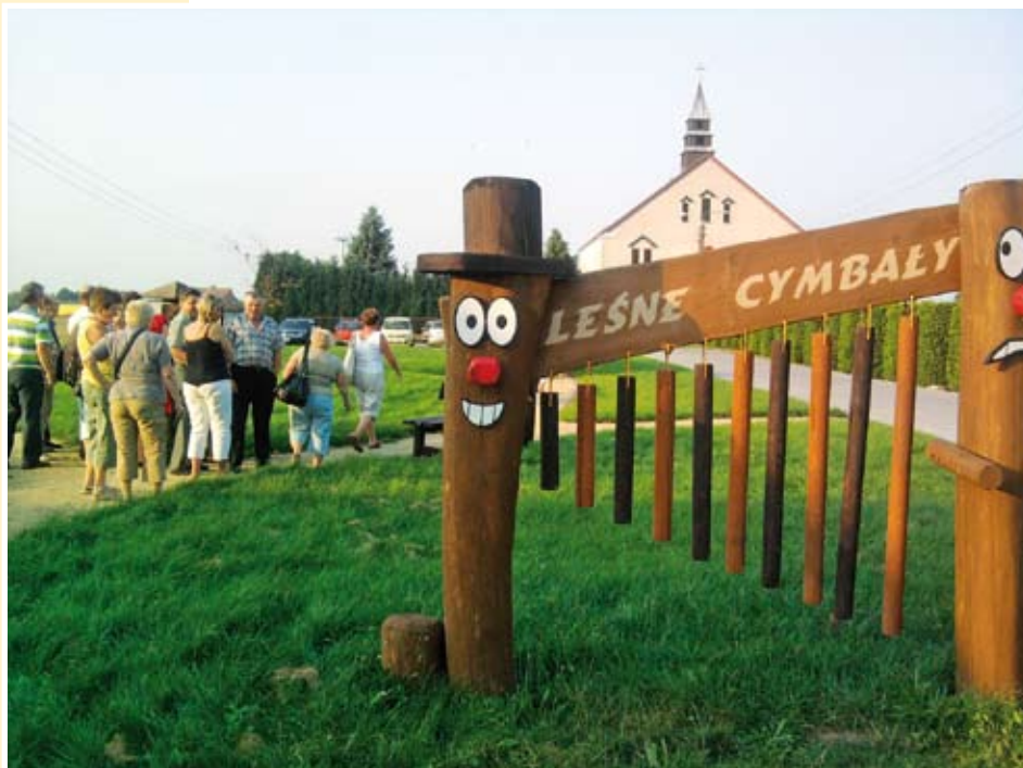
Ścieżka edukacyjna w Borkowicach

Zajęcia edukacyjne adresowane są do dzieci i młodzieży w wieku od 5 do 16 lat, a do odwiedzenia miejscowości mieszkańcy zapraszają wszystkich tych, którzy w twórczy i ciekawy sposób chcą spędzić swój wolny czas.