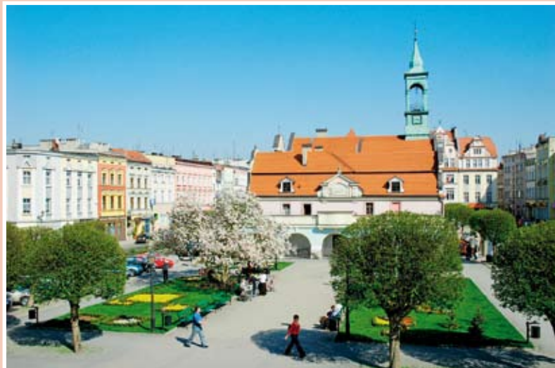
Kluczbork – rynek