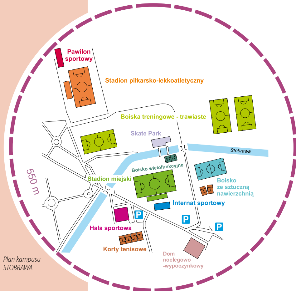
Plan kampusu STOBRAWA