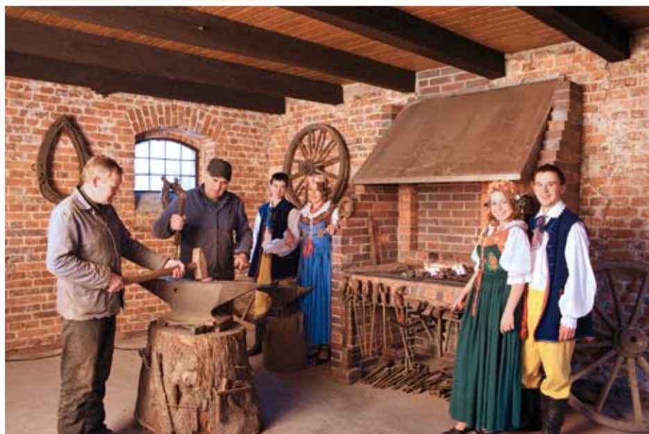
Zabytkowa kuźnia w Kuniowie

Po zwiedzeniu Kuniowa wracamy do miejsca koło krzyża, gdzie stoi drogowskaz i jedziemy szlakiem żółtym w kierunku południowo-zachodnim. Wyjeżdżając z Kuniowa przekraczamy tory kolejowe, a następnie jedziemy obwodnicą i drogą szutrową do odległego o około 3,7 km Przysiółka Wawrzyńcowskie i do widocznej z prawej strony wsi o nazwie Bażany (Basan). Tu przekraczamy drogę asfaltową Jasienie-Bażany i jedziemy dalej prosto w kierunku Osi. Po przejechaniu 900 m znajdujemy się przy ostatnich zabudowaniach przysiółka w obszarze Lasów Stobrawsko-Turawskich. Na pierwszym skrzyżowaniu w lesie, po 550 m, skręcamy w prawo . Tu szlak wspólnie biegnie z trasą pieszą zieloną „Po Bezdrożach Wiedzy” przez Bażany, Zameczek i Żabiniec. Po przejechaniu kolejnych 700 m z lewej strony wylania się polana, a po przeciwnej stronie tablica informacyjna leśnego rezerwatu przyrody „Bazany” . Jest to jedyny w gminie Kluczbork rezerwat, w którym chroni się naturalne stanowisko sosny na piaszczystych wydmach. Obficie występuje tu jałowiec pospolity.