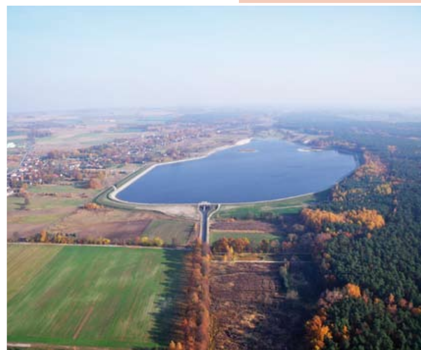
Zbiornik retencyjny KLUCZBORK

Po drodze do dawnego Domku Strzeleckiego, w którym obecnie znajduje się klasztor Księży Sercanów, mijamy kompleks boisk sportowych, stadion miejski i korty tenisowe. Obok wspomnianego klasztoru szlak żółty i niebieski skręca w prawo . Wjeżdżamy w leśną ścieżkę szlakiem zielonym docierając do leśnej górkę, która przed wojną spełniała rolę toru saneczkarskiego i trasy narciarskiej. Dalej jedziemy prosto szlakiem zielonym w kierunku zbiornika retencyjnego na Stobrawie, gdzie w letnie dni mogą odpoczywać mieszkańcy gminy, a który ma szansę stać się atrakcją turystyczną tego regionu.