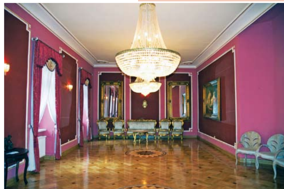
Pałac w Maciejowie – sala balowa

łe w naszej pamięci. Jadąc w prawo na skrzyżowaniu w Łowkowicach docieramy do kościoła pw. Nawiedzenia Matki Boskiej wzmiankowanego w 1517 r. Do 1810 r. był on pod patronatem Krzyżowców z Czerwoną Gwiazdą. Obecny został zbudowany w 1827 r., orientowany, murowany. Prezbiterium zamknięte jest trójbocznie, a przy nim zakrystia i składzik. Szersza i wyższa nawa na rzucie wydłużonego prostokąta, a przy niej dwie niewielkie kruchty, od zachodu kwadratowa wieża; ściany zwieńczone są gzymsem kostkowym. Chór muzyczny drewniany, wsparty na dwóch słupach. Na zewnątrz prezbiterium opięte szkarpami o jednym uskoku; dachy trójspadowe, kryte dachówką. Wieża, podzielona gzymсами na trzy kondygnacje, zwieńczona jest gzymsem kostkowym. Dwa ołtarze boczne, klasycystyczne z I połowy XIX w., w jednym z nich znajduje się obraz Matki Boskiej Różańcowej (1847/48); organy późnoklasycystyczne z I poł. XIX w. Na cmentarzu przy kościele znajduje się grób ks. Jana Dzierżona, wybitnego pszczelarza.