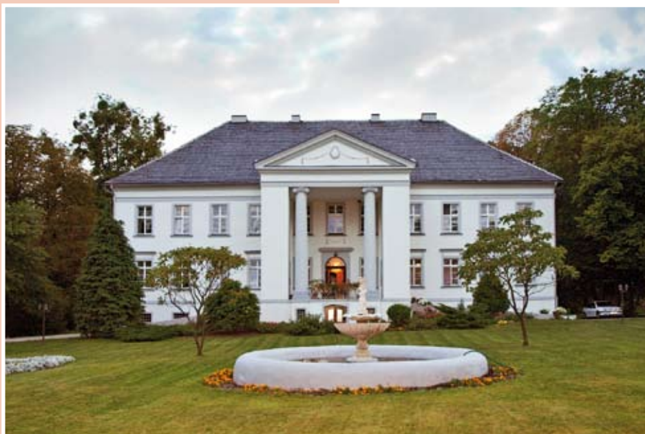
Pałac w Maciejowie

Pałac posiada status muzeum, a po wcześniejszym zgłoszeniu istnieje możliwość jego zwiedzenia w towarzystwie przewodnika, dzięki któremu możemy poznać tajemni-