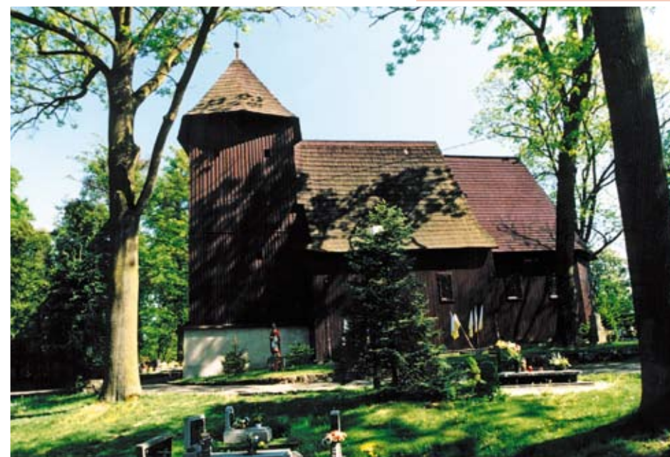
Kościół pw. Wniebowzięcia Np. Marii w Bąkowie

Skręcając w prawo dojeżdżamy po 1,5 km do kolejnej wsi. Bąków (Bankau) w gminie Kluczbork to wieś położona ok. 9 km na wschód od stolicy gminy wśród malowniczych lasów i 7 stawów. W pobliżu wsi znajdują się grodziska z XIII-XIV w. Na skrzyżowaniu koło szkoły ma swój początek szlak czarny, a na drugim skrzyżowaniu szlak czerwony skręca w prawo , a zielony w lewo .