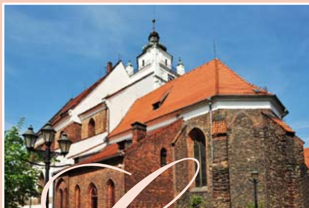
Kościół ewangelicki pw. Zbawiciela