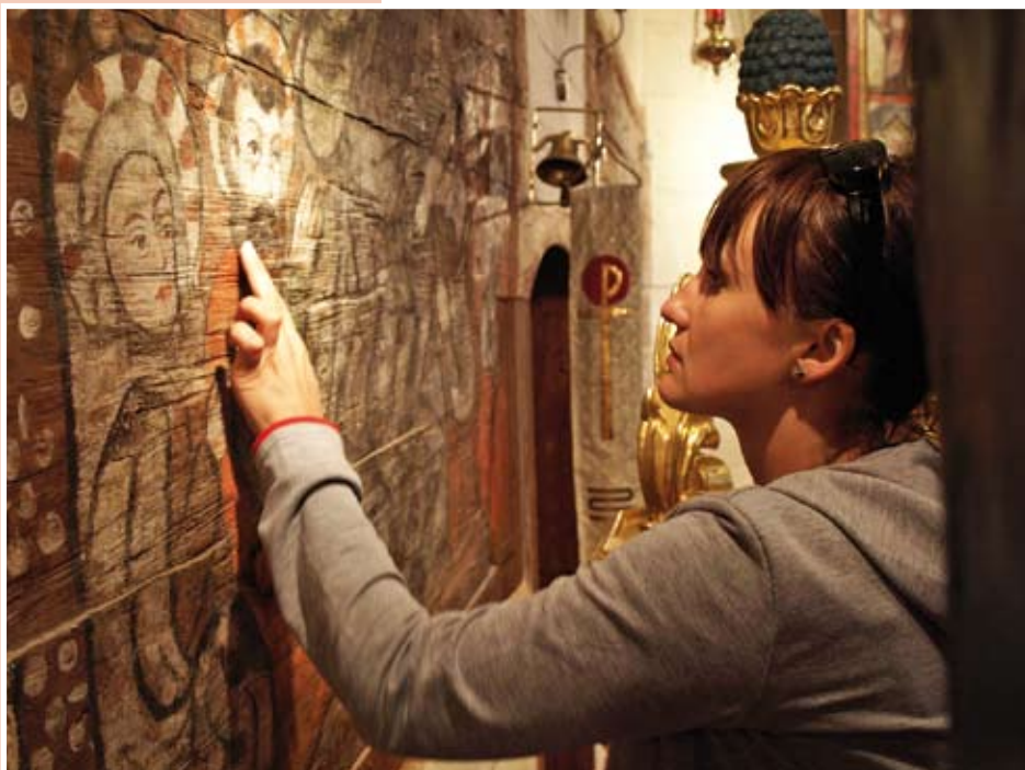
Kościół pw. Wniebowzięcia NP. Marii w Bąkowie – polichromie

Po przejechaniu ok. 300 m szlakiem zielonym docieramy do drewnianego kościółka pw. Wniebowzięcia NP Marii . Jest to jedyny przedreformacyjny kościół w gminie Kluczbork. Zbudowany został on na przełomie XV i XVI w., orientowany, konstrukcji zrębowej, na podmurowaniu ceglany, z wieżą nakrytą ośmiobocznym gontowym dachem namiotowym, o konstrukcji słupowej. W nawie chór muzyczny z parapetem wybrzuszonym w części środkowej i łączące się z nim empory wzdłuż ścian bocznych, wsparte na siedmiu profilowanych lub fazowanych słupach (koniec XVII w.). Ołtarz główny to tryptyk gotycki z II poł. XVI w., rzeźbiony z malowanymi skrzydłami, z częścią środkową trójdzielną. Ambona barokowa z 3 ćwiartki XVII w., wsparta na lwie trzymającym kartusz herbowy. Chrzcielnica barokowa (koniec XVII w.), organy regencyjne.