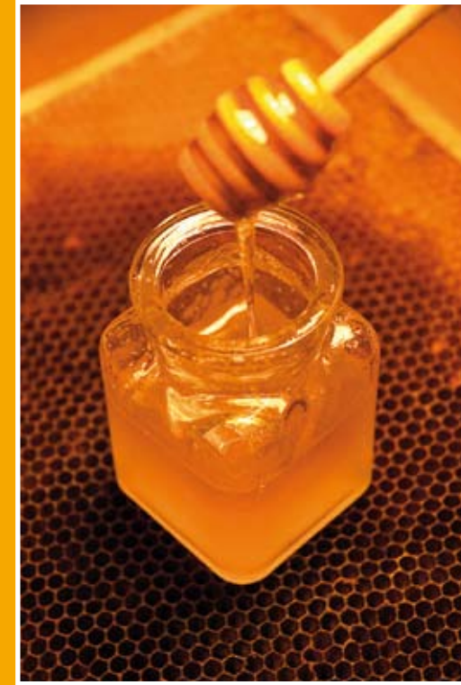
Gmina Kluczbork – miodem płynąca, kołoczem pachnąca

Miód zawdzięczamy pracowitym pszczołom, które szczególnie upodobały sobie pola i lasy Ziemi Kluczborskiej. Odkrywcą tajników życia pszczół był ks. dr Jan Dzierżon (1811-1906) światowej sławy pszczelarz, urodzony w Łowkowicach koło Kluczborka. W Muzeum im. Jana Dzierżona można zwiedzać ekspozycję stałą pn. „Pszczelarstwo dawne i nowe”.