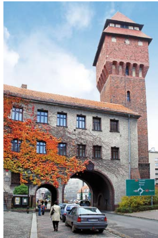
Muzeum im. Jana Dzierżona

Dawny Zakład dla Ubogich (ul. Zamkowa 6) – klasycystyczny budynek zbudowany według projektu słynnego Carla Gotharda pochodzi z 1779 r. i zbudowany był na planie litery H (Gothard był też projektantem Bramy Brandenburskiej). Od 1804 r. mieścił się tu szpital, który przekształcono w 1874 r. w szpital dla umysłowo chorych. W czasie II wojny światowej był tu jeniecki obóz oficerski.