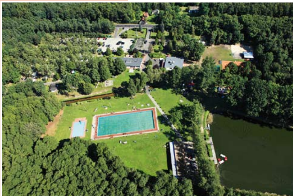
Ośrodek Turystyczno-Wypoczynkowy w Bąkowie

Obok zbiornika znajduje się strzelnica, która nie jest wykorzystana. W tym miejscu szlak skręca w prawo za drogą wyłożoną płytami betonowymi. Po około 200 m szlak skręca w lewo przez las do Ośrodka Turystyczno-Wypoczynkowego w Bąkowie . Ośrodek oddalony jest 5 km od Kluczborka, usytuowany bezpośrednio przy drodze krajowej nr 11 Poznań-Katowice. Czynny jest przez cztery miesiące (czerwiec-wrzesień).