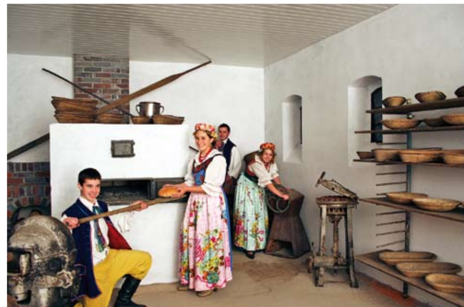
Zabytkowa piekarnia w Kuniowie

We wsi Kuniów istnieją także szczątki XIX-wiecznej kuźni i piekarni. Ze względu na to dziedzictwo Stowarzyszenie Na Rzecz Rozwoju Wsi Kuniów utworzyło zabytkowe pomieszczenia regionalne pod nazwą „Izba Pamięci Regionalnej i Rzemiosła”. W oryginalnym piecu odbudowanej kuźni, przy użyciu narzędzi z XIX w., można wykuć „Podkowę Kuniowa”, a w piekarni samego wyrobić i wypieć „Chleb Kuniowski” przygotowany według dawnej receptury. Po pracy, gotowy wypiek spożywa się przy stylowych ławach wśród zabytkowych eksponatów.